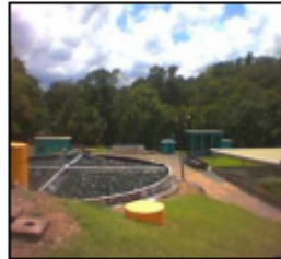
ELIMINACIÓN FASE I PAS SABANA GRANDE INV. = $ 8.9 M. MUNICIPIOS BENEF. =