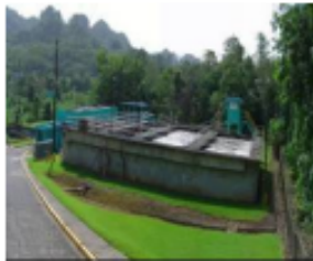
EXPANSIÓN Y MEJORAS PAS CIALES INV. = $ 8.7 M. MUNICIPIOS BENEF. = CLIENTES BENEF. =