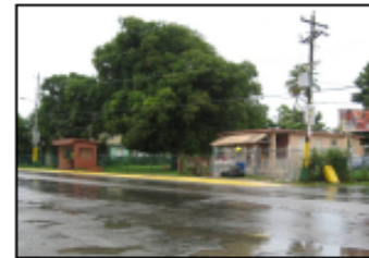
SISTEMA SANITARIO COM. INGENIO INV. = $ 15.3 M. MUNICIPIOS BENEF. = CLIENTES BENEF. =